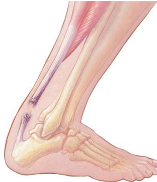
تصویر پاشنه پا با بریدگی تاندون آشیل